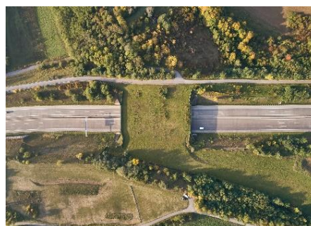
Grünbrücke für bodengebundene Tiere über der Autobahntrasse